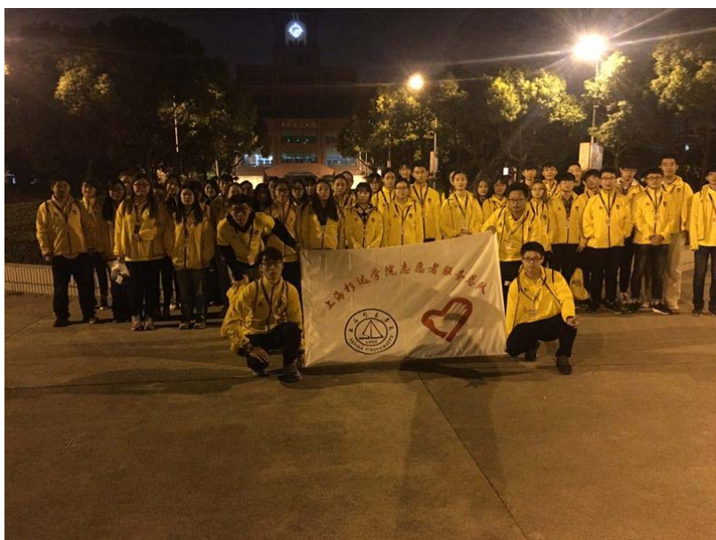
凌晨五点，我们的志愿者到达赛场，第一次见到了凌晨的陆家嘴。